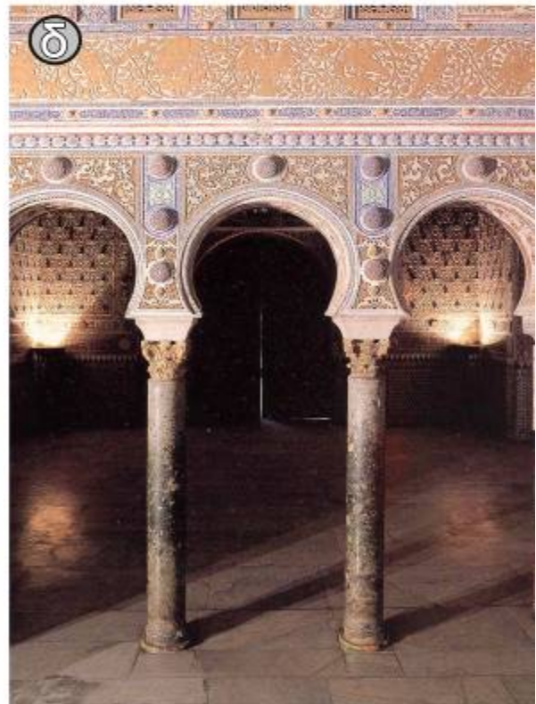
Εικ. 4. α. Οφτιασβεστίτης Χασόμπαλης. β. Εσωτερική επένδυση και κίονας από το πράσινο λίθο, Αγία Σοφία, Κωνσταντινούπολη. γ. Πράσινοι κίονες στην Αχειροποίητο, Θεσσαλονίκη, δ. Ανάκτορο Alcazar, Σεβίλλη Ισπανίας.