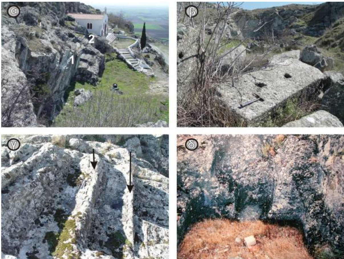
Εικ. 3. Λατομεία ρωμαϊκής και βυζαντινής περιόδου στη Χασάμπαλη του Δήμου Νέσσωνας.

Στους πρόποδες Κισσάβου εκτός από το λευκό μάρμαρο εντοπίζεται ένα εξαιρετικά δυσεύρετο πέτρωμα που αποτέλεσε για περίπου 2000 χρόνια ένα από τα πολυτιμότερα και ακριβότερα διακοσμητικά δομικά υλικά και από το οποίο κατασκευάστηκαν μοναδικά αρχιτεκτονικά θαύματα, μεταξύ των οποίων και η Αγία Σοφία στην Κωνσταντινούπολη. Μιλάμε για τον Πράσινο Θεσσαλικό λίθο, γνωστό και ως «verde antico», που εξορύχθηκε στην περιοχή Χασάμπαλη του Δήμου Νέσσωνας (Εικ 3). Πρόκειται για ένα ασυνήθιστο και σχετικά σπάνιο πέτρωμα που ονομάζεται οφίτασβεσίτης και το οποίο προξένησε το ενδιαφέρον και το θαυμασμό τόσων και τόσων αυτοκρατόρων, βασιλιάδων και σουλτάνων, ποιητών και συγγραφέων, μηχανικών και αρχιτεκτόνων, περιηγητών και ταξιδευτών από όλο τον κόσμο.